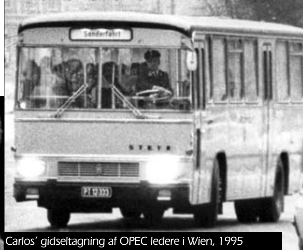
Carlos' gidseltagning af OPEC ledere i Wien, 1995