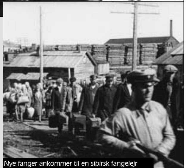
Nye fanger ankommer til en sibirisk fangelejr