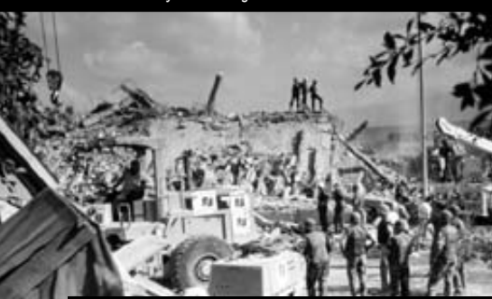
Beirut: Bombningen af den amerikanske flådekaserne i 1983