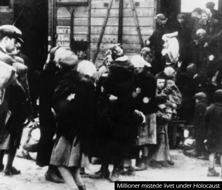
Millioner mistede livet under Holocaust