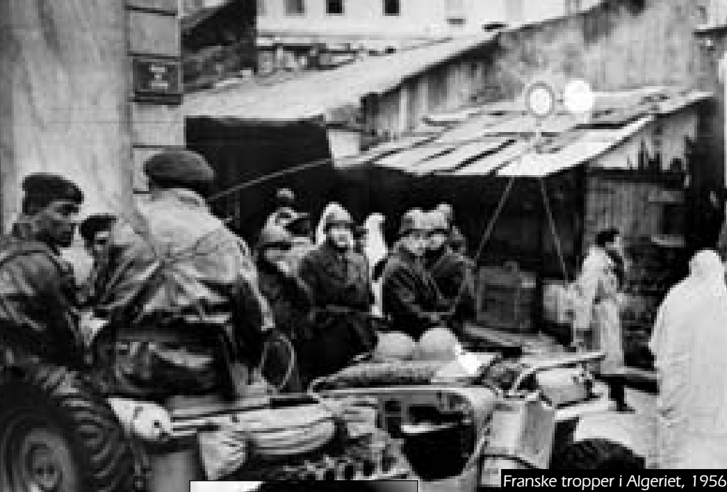
Franske tropper i Algeriet, 1956

Franz Fanon var blevet opildnet af den Algeriske selvstændighedskrig (ovenfor) i 1954, og han udnyttede sin uddannelse som psykiater til at gøre sig til talsmand for terrorisme som en nobel bestræbelse, og han prædikede om, at vold var nødvendigt for at opnå frihed og psykisk sundhed.