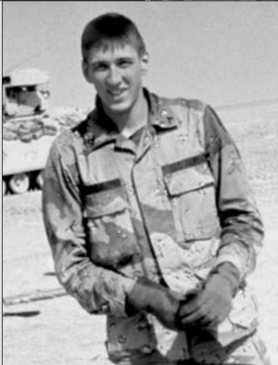
Timothy McVeigh: Under operation Ørken Storm 1991