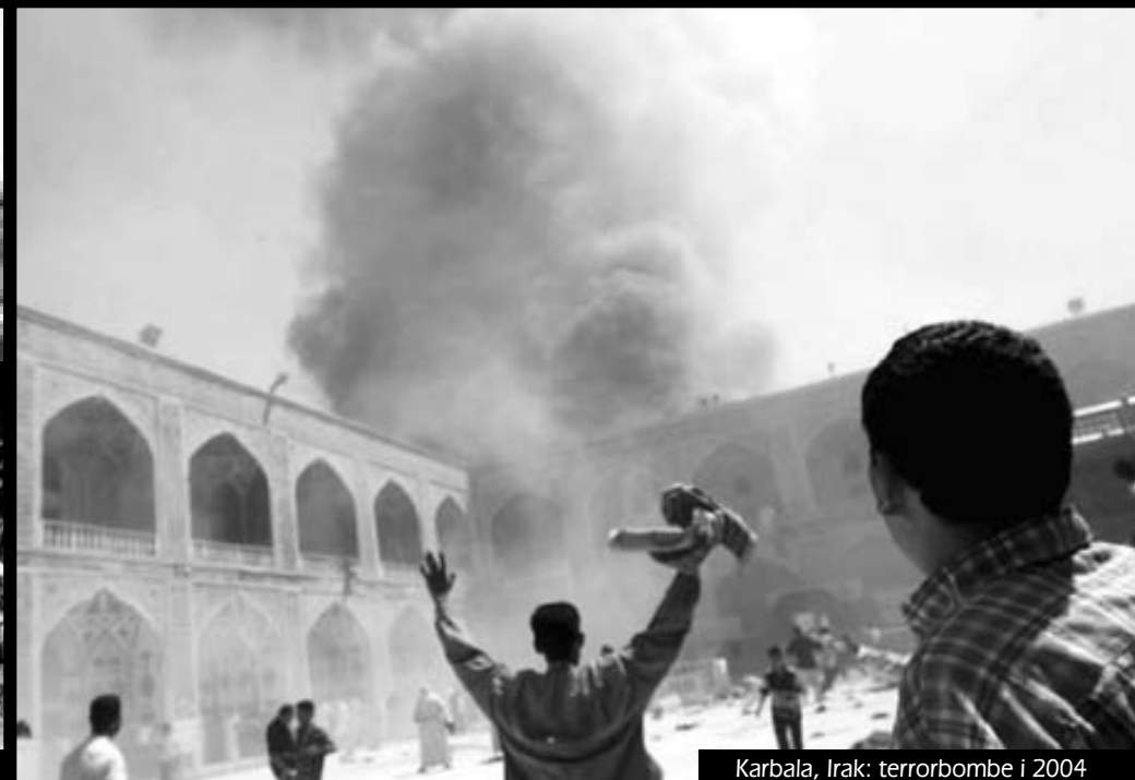
Karbala, Irak: terrorbombe i 2004