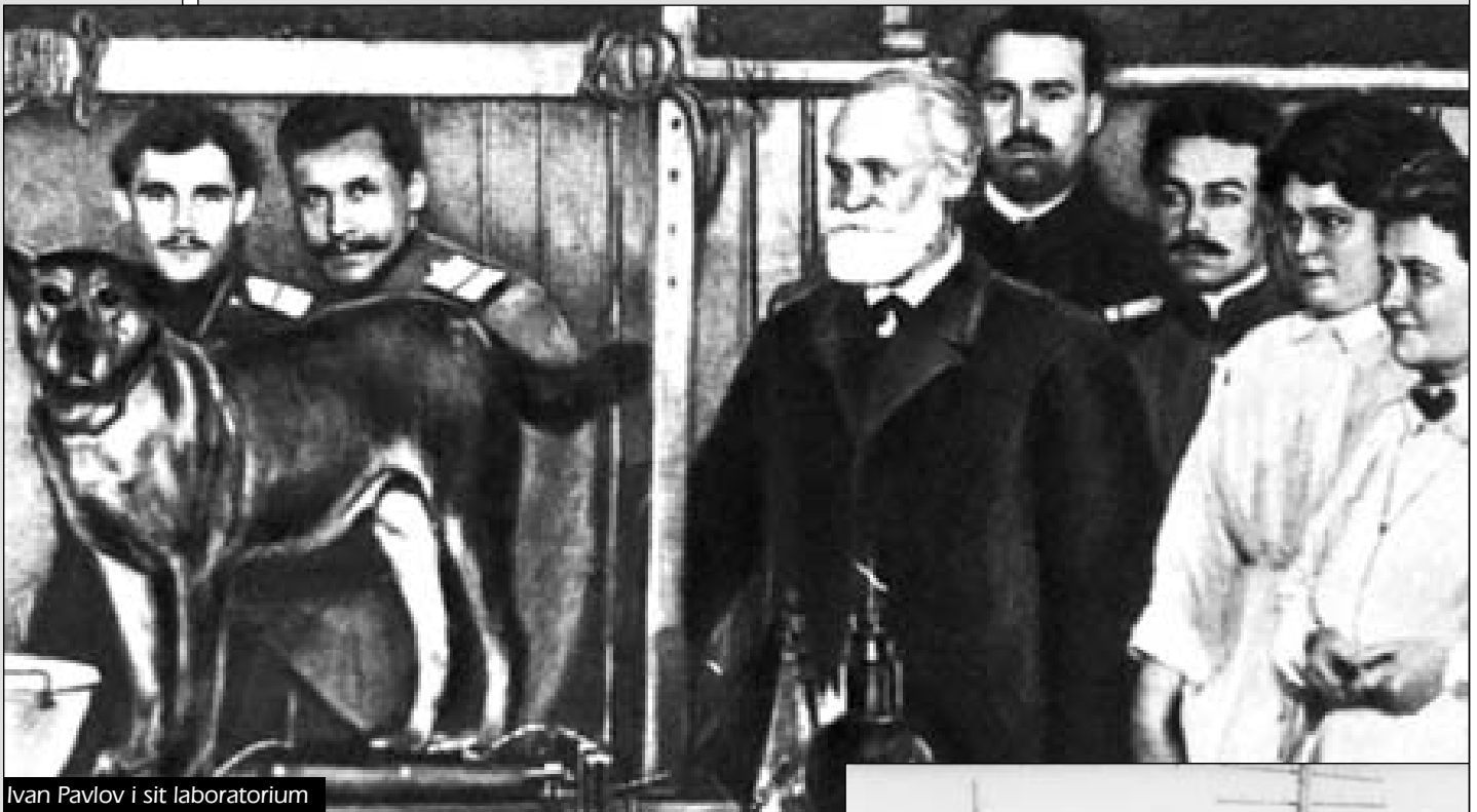
Ivan Pavlov i sit laboratorium

Russiske psykiatere anvendte Pavlovs forskning med "betingede reflekser" på hunde for at fastslå, at mennesket simpelthen var et programmerbart dyr, på fængslede sovjetiske systemkritikere i lejre, hvor de blev givet psykiatriske stoffer, fik elektrochok og blev reduceret til medgørlige zombier.