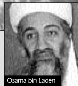
Osama bin Laden