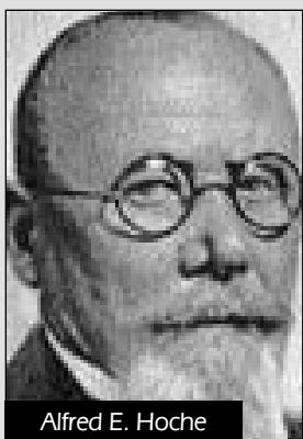
Alfred E. Hoche

I de tidlige 1920'ere læste den spirende politiker Adolf Hitler om de tyske racehygiejnefolks ideer, og han blev dybt inspireret. To bøger, der var skrevet af psykiaterne Alfred Plötz og Alfred Hoche, henholdsvis 'Vor races egnethed og beskyttelsen af de svage' (1905) og 'Tilladelse til at tilintetgøre liv, der ikke er værdigt' (1920), hjalp Hitler med at fuldende de teorier, han udtrykte i sin bog 'Mein Kampf' fra 1924 – bogen, der banede vejen for mord på millioner af mennesker. Som Hitler sagde: "Retten til den personlige frihed viger for pligten til at bevare racen."