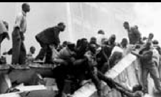
Kenya: Bombningen af den amerikanske ambassade i 1998